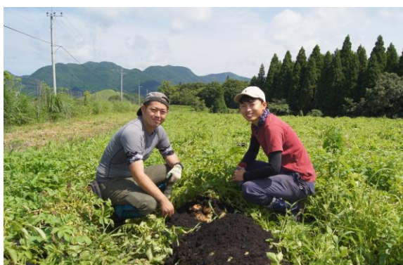
左から佐藤農場長と川口副農場長