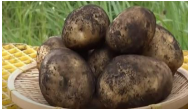
7月上旬頃 立派な有機栽培のじゃがいも！